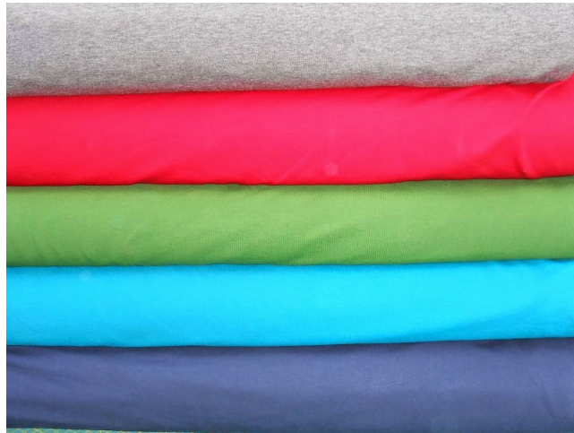
wundervoller dünner Sommersweat