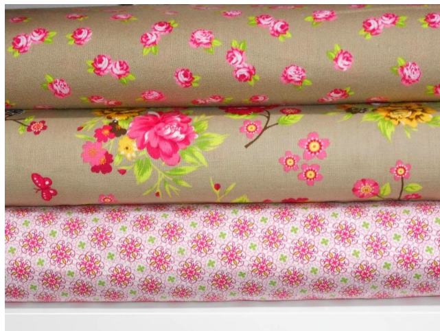
Bellissimi Fiori - ein traumhafter Stoff